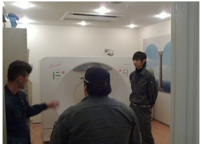
作業責任者による作業前ミーティング②