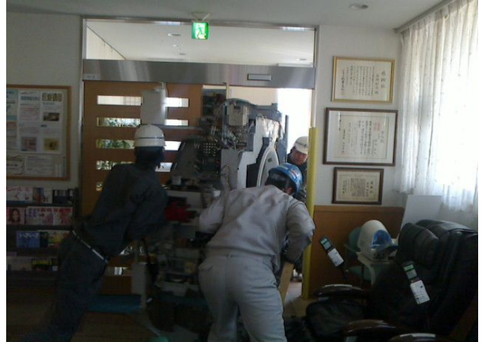
衝突に気を付けて ゆっくりと搬出