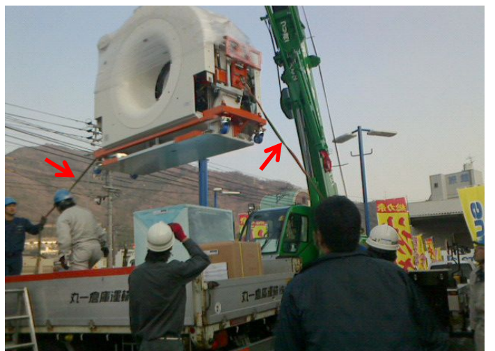
レッカーにて吊り上げ荷下ろし 機械が風に煽られないよう、向きが変わらないよう、案内ロープ取付け