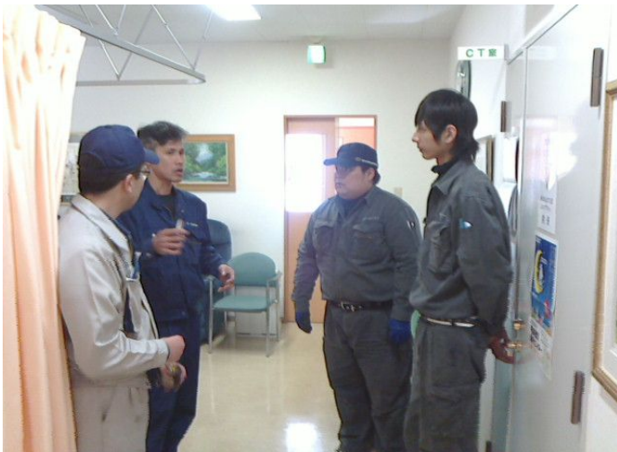
作業責任者による作業前ミーティング実施①