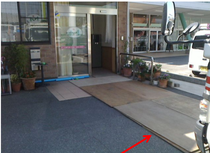
搬入口前スロープ 機械重量が1.6tもあるため、少しの傾斜も平らに。