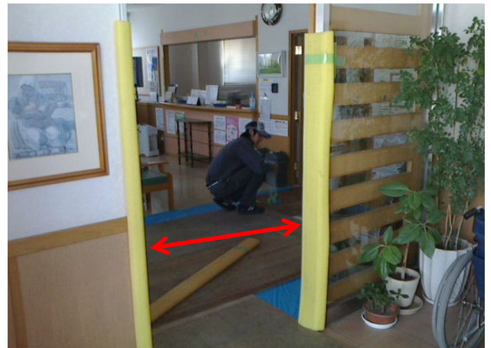
内部 自動ドア養生 機械幅ギリギリ